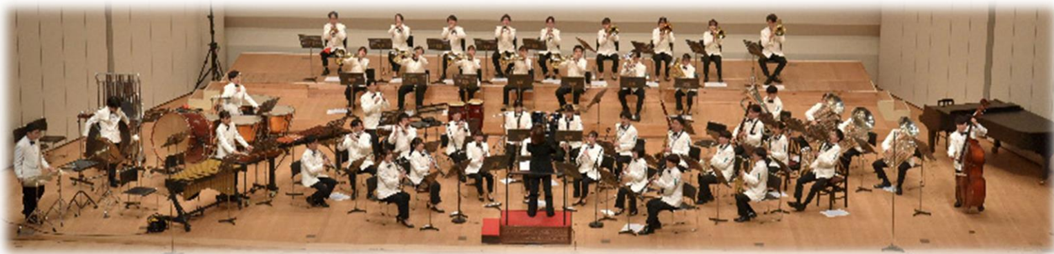
第71回全日本吹奏楽コンクールでの演奏